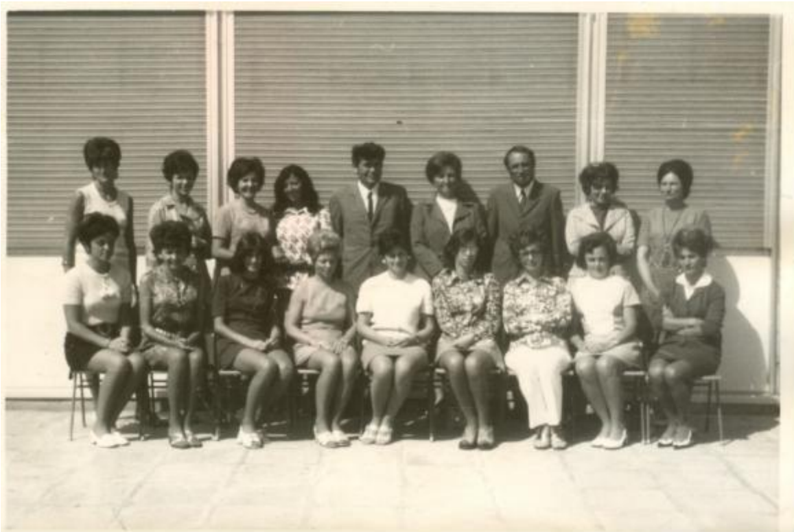
Az első tantestület